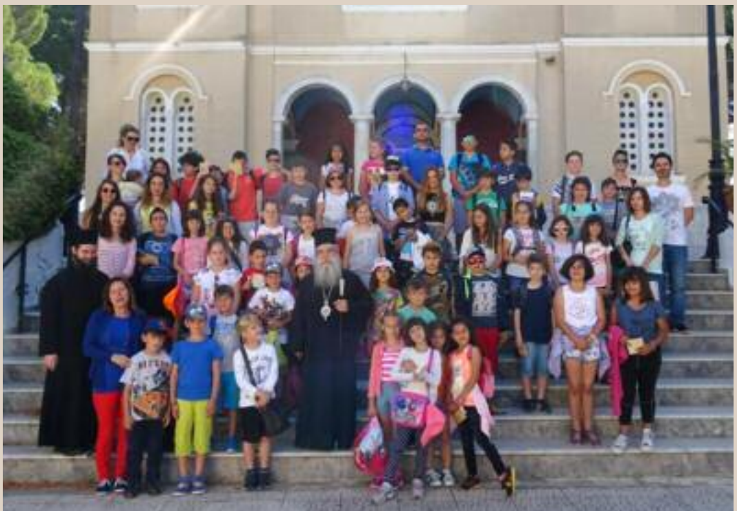
Από την επίσκεψη του Δημοτικού Σχολείου Βαλύρας στον Σεβ. Μητροπολίτη μας (Σπάρτη, 26/5/2016)