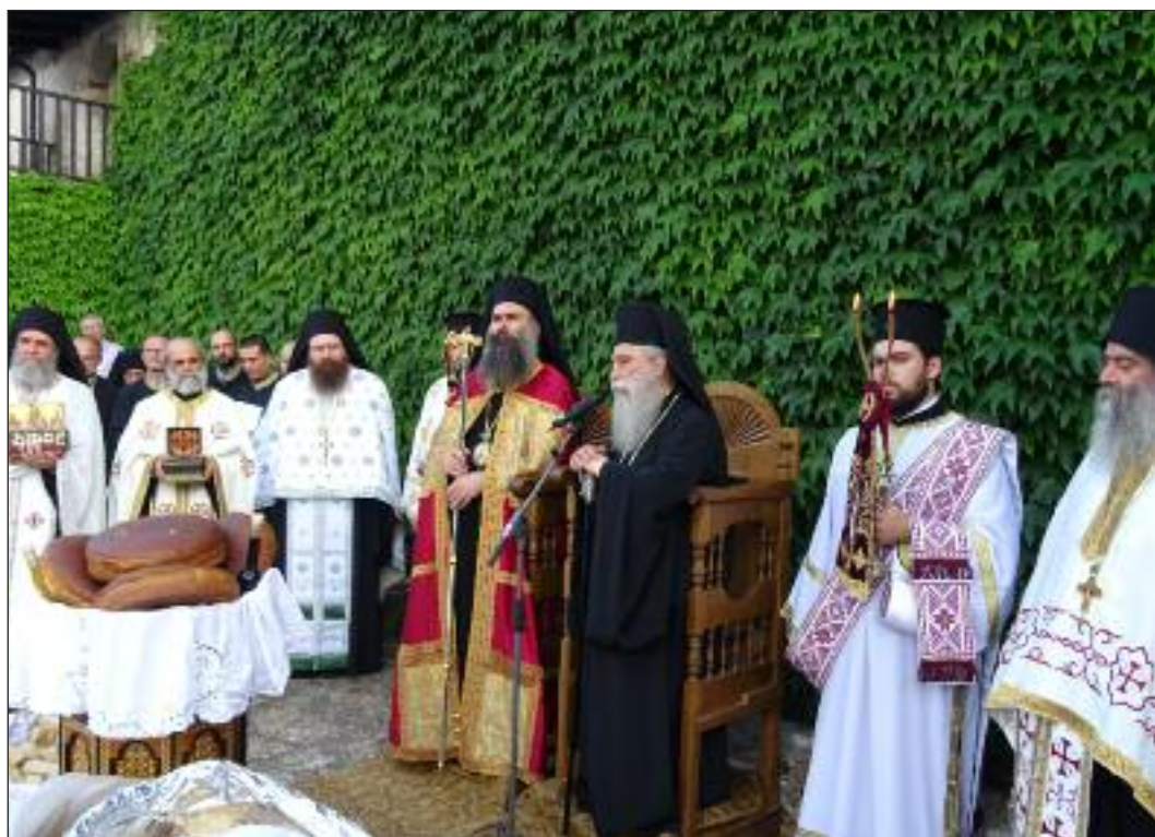
Άπό τήν πανήγυρη τῆς Ἱερᾶς Μονῆς Ἁγίων Ἀναργύρων Πάρνωνος προεξάρχοντος τοῦ Σεβ. Μητροπολίτου Ἐλασσώνος κ. Χαρίτωνος (30/6/2016)