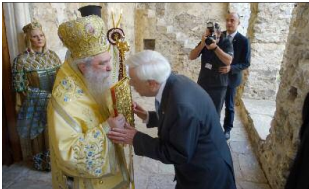
Από την έορτή τών Παλαιολογείων στό Μητροπολιτικό Ναό τοῦ Μυστρά, παρουσία τοῦ Προέδρου τῆς Δημοκρατίας κ. Προκοπίου Παυλόπουλου (Μυστράς, 29/5/2016)