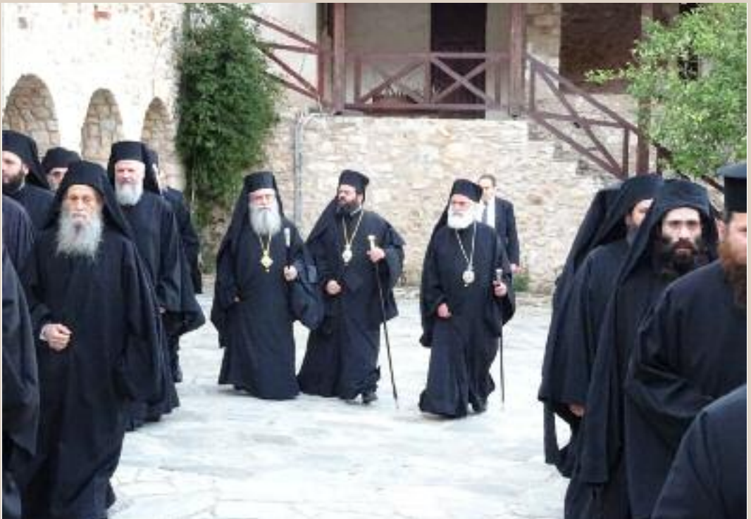
Από την πανήγυρη τής Ιερᾶς Μονῆς Ἀγίων Τεσσαράκοντα Μαρτύρων μέ τή συμμετοχή τών Σεβ. Μητροπολιτῶν Ξάνθης κ. Παντελεήμονος, Μαρωνείας κ. Παντελεήμονος καί τοῦ Σεβ. Ποιμενάρχου μας κ. Εὐσταθίου (8/3/2016)