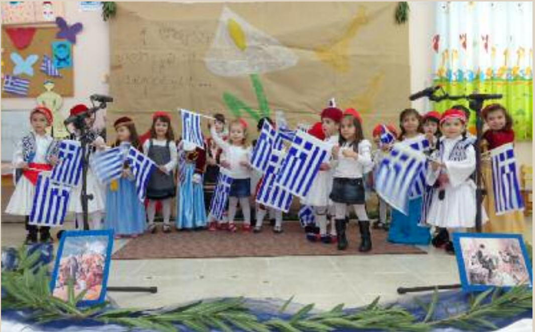
Από την έορτή τών παιδιών του Βρεφονηπιακού Σταθμού «Ο Άγιος Βασίλειος» για την 25η Μαρτίου