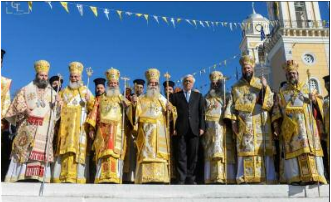
Από τη συμμετοχή του Σεβ. Μητροπολίτου μας κ. Εύσταθίου στην έορτή της Παναγίας Ύπαπαντης με την παρουσία του Προέδρου της Ελληνικής Δημοκρατίας κ. Προκόπη Παυλόπουλου (Καλαμάτα, 2/2/2016)