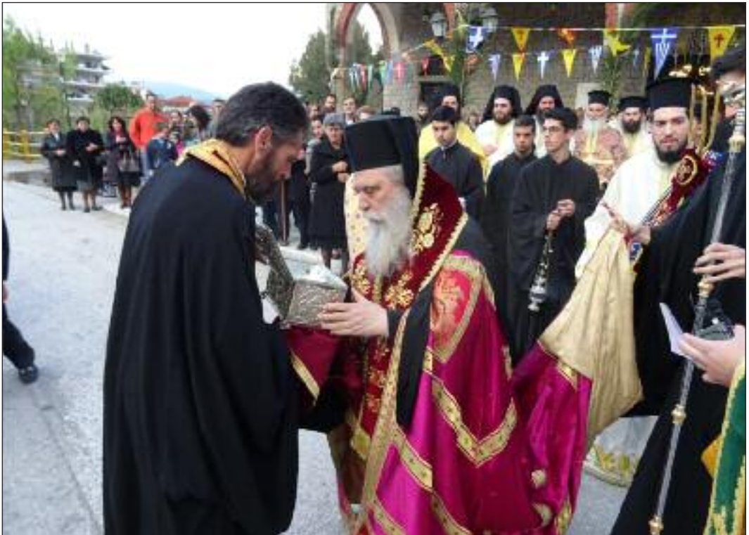
Από την ύποδοχή του Ίερού Λειψάνου του Όσιου Λεοντίου του Μονεμβασιώτου κατά την πανήγυρη των Λακώνων Αγίων (Σπάρτη, 26/3/2016)