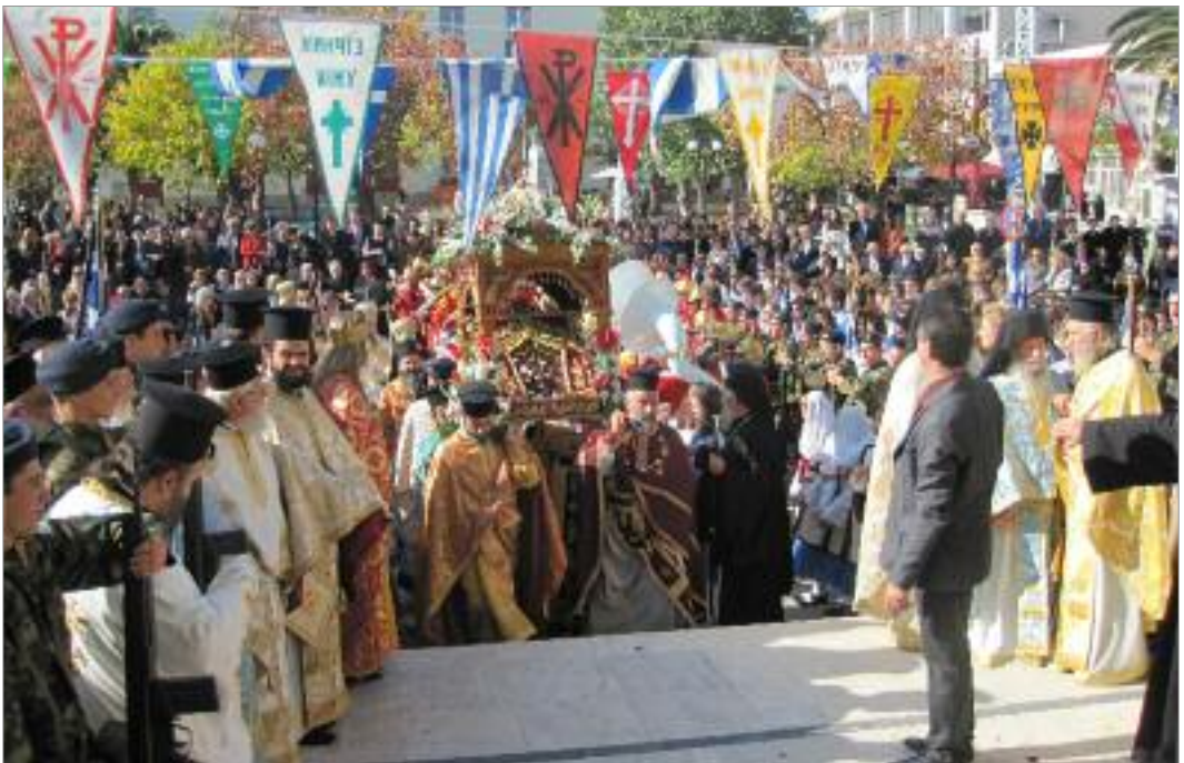
Ἐκδοχὴ ἀπὸ τῆς λιτανείας τῆς Ἱερᾶς Εἰκόνας τοῦ Ὁσίου Νίκωνος, Πολιοῦχου Σπάρτης