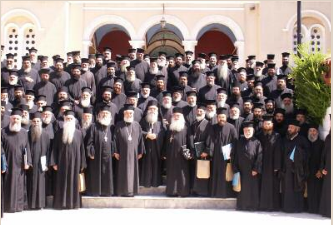
Από τὸ Γενικὸ Ἱερατικὸ Συνέδριο (Σπάρτη, 04-09-2012)