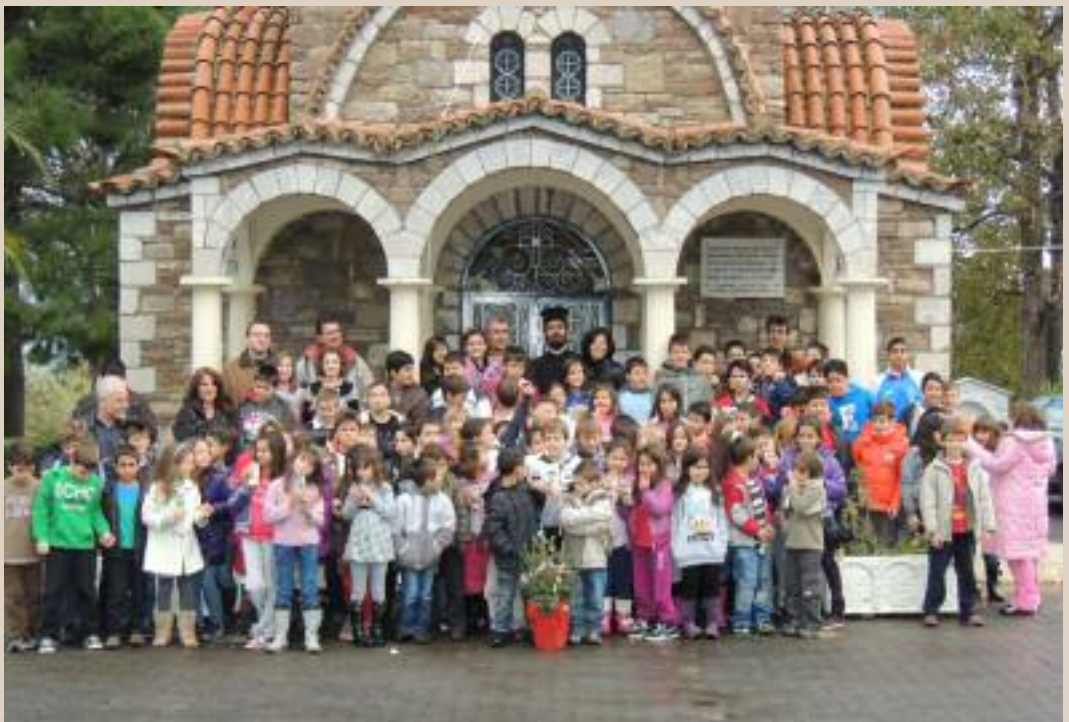
Απὸ τὴν ἐπίσκεψι Δημοτικοῦ Σχολείου στὸ ἄσυλο Ἀνιάτων Σπάρτης κατὰ τὴν Παγκόσμια Ἡμέρα Ἀτόμων μὲ Ἀναπηρία (03-12-2012)